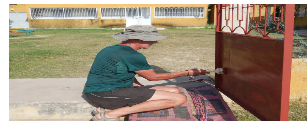
Peinture du portail de l'école