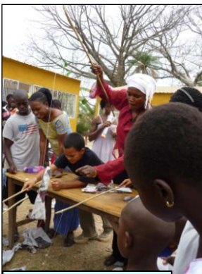
La pêche sera bonne...

Dimanche nous voilà plongés dans l'ambiance de la fête à Harmonie. Les enseignants avaient préparé des saynètes et des chants en notre honneur. La kermesse a permis à petits et grands de pêcher à la ligne des objets rapportés de France. Une maman félicitée pour la jolie robe de sa fille a dit l'avoir empruntée pour l'occasion. Les femmes du GIE ont fabriqué des fatayas. Les bénéficiaires soigneusement comptés et conservés par Pierre vont à la caisse de l'école.